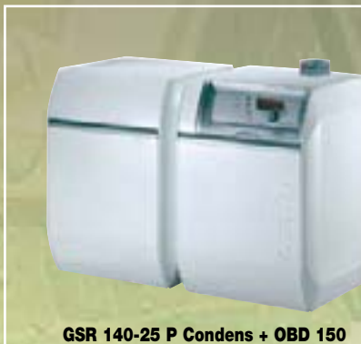
GSR 140-25 P Condens + OBD 150