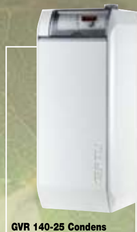
GVR 140-25 Condens