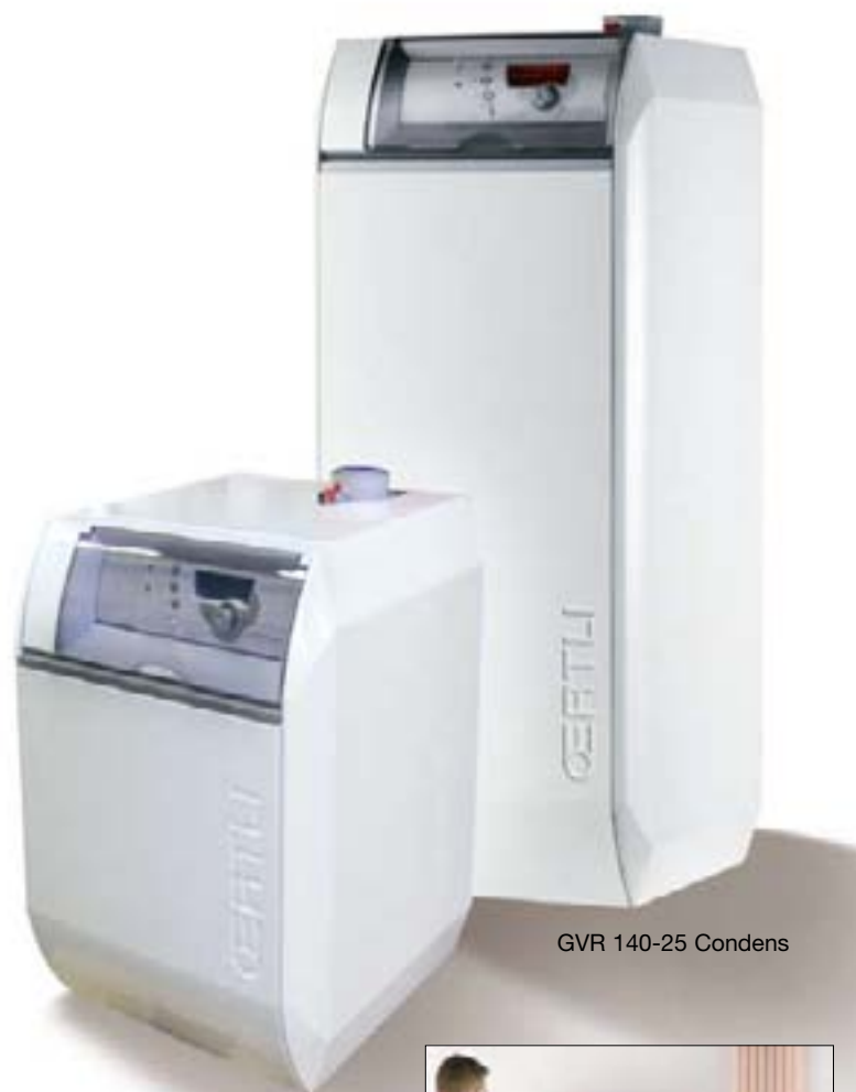
GVR 140-25 Condens