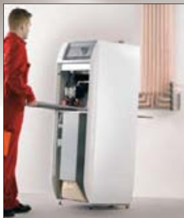
GSR 140-25 P Condens