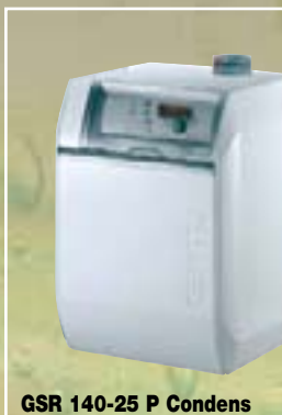
GSR 140-25 P Condens